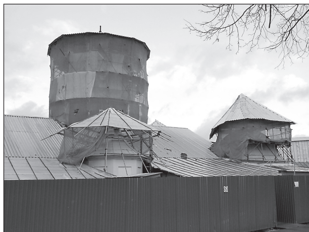
В монастыре идут реставрационные работы