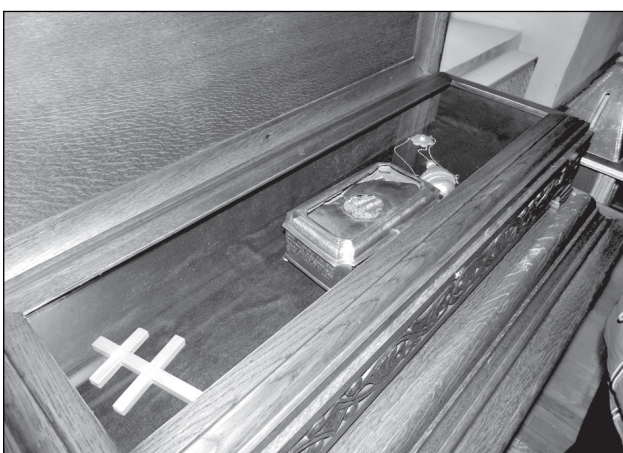
Рака с десницей мученицы Татианы