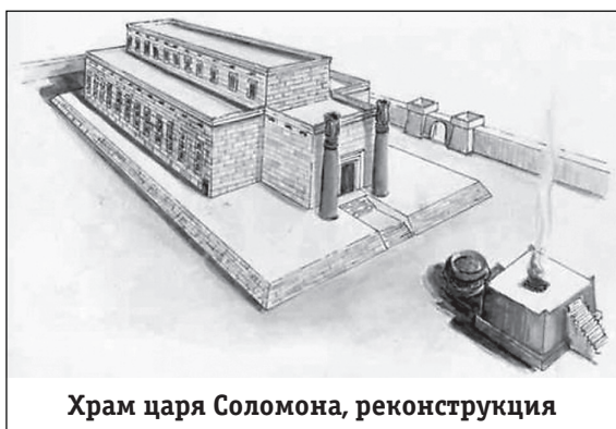
Храм царя Соломона, реконструкция

Будем же особенно внимательны, дорогие мои, созидая и восстанавливая теперь в большом количестве рукотворенные