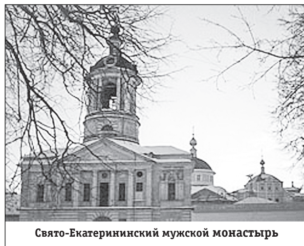
Свято-Екатерининский мужской монастырь

Накануне празднования вмц. Екатерине планируется поездка на праздничное Всенощное бдение в Свято-Екатерининскую пустынь. Желающие могут узнать подробную информацию по тел: 8 920 953 48 41.