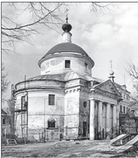
Соборный храм вмц. Екатерины