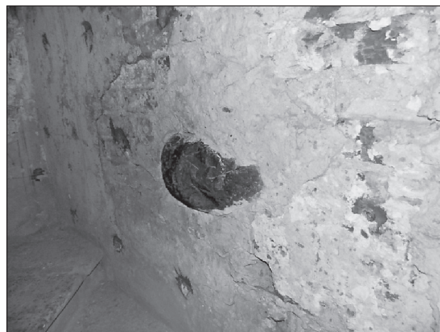
Камень из Иудейской пустыни