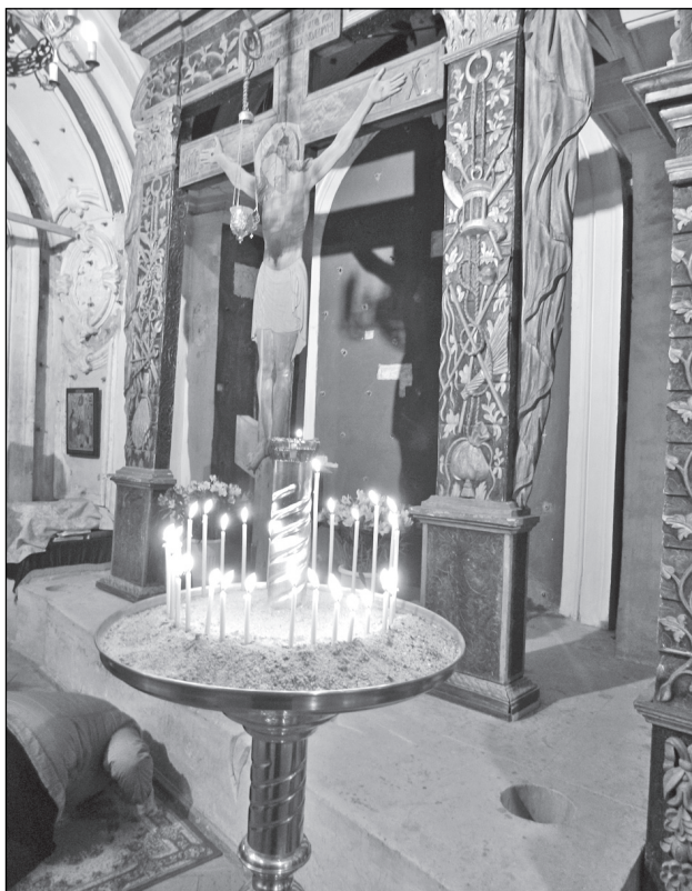
Голгофа. Этому кипарисовому Кресту уже триста лет