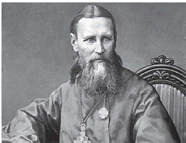
Святой Иоанн Кронштадтский

Святая Церковь празднует ныне – и мы с нею торжествуем – пресветлый праздник Преображения Господня на горе Фаворской и прославления нашего человеческого естества в лице Господа Иисуса Христа. Повторю русскою речью евангелие или всерадостное благовестие Матфея о нынешнем дне, повествующее о событии преобразования. "В то время взял Иисус Петра, Иакова и Иоанна, брата его, и возвел их на гору высокую одних. И преобразился пред ними: и просияло лице Его, как солнце, одежды же Его сделались белыми, как свет.